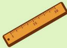
Meetlat of meetlint